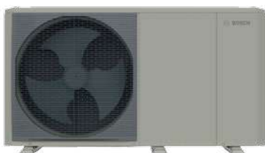
Μικρό μέγεθος (4kW-6kW)