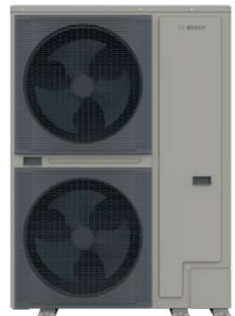
Μεγάλο μέγεθος (18kW-30kW)